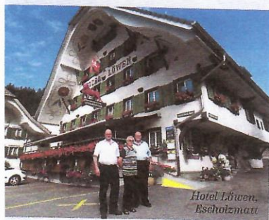
Hotel Löwen, Escholzmatt